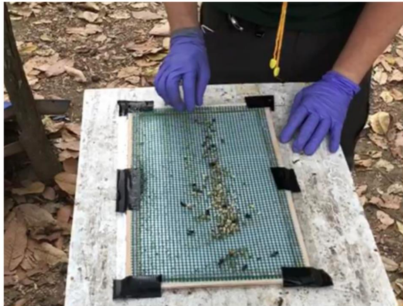
Fig 2. Dead brood on a sticky floor insert placed below a mesh screen from a colony where brood frames had been 'bumped' 24 hours previously.

Maggie C. Gill 1* , Bajaree Chuttong 2 , Paul Davies 3 , Dan Etheridge 3 , Lakkhika Panyaraksa 2 , Victoria Tomkies 4 , George Tonge 3 , Giles E. Budge 5