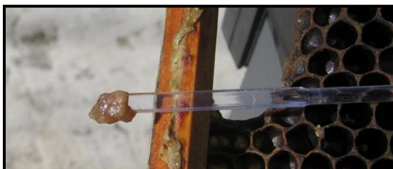
Larver med brunlig farve

Denne sygdomsbeskrivelse er udformet med henblik på at hjælpe med genkendelse af de kliniske tegn på sygdommen i honningbifamilien.