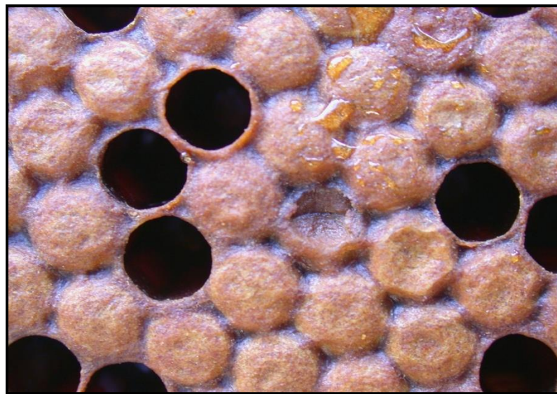
Mørke indsunkne celledåg

Denne sygdomsbeskrivelse er udformet med henblik på at hjælpe med genkendelse af de kliniske tegn på sygdommen i honningbifamilien.