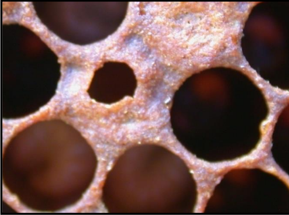
Huller i cellelåg