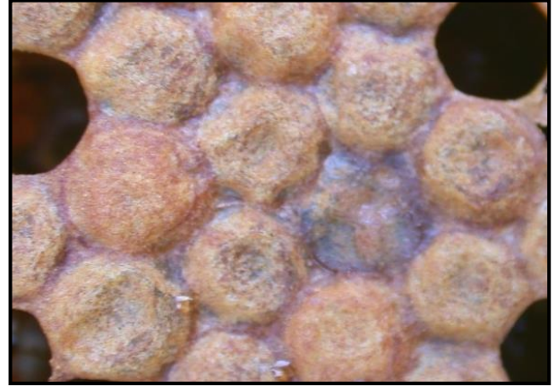
Mørke indsunke cellelåg