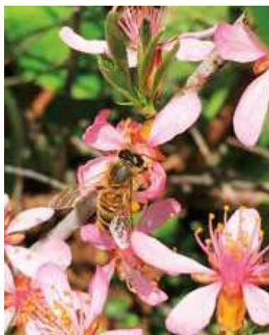
Figur 2. Dværgmandel - Pia Rasmussen (28. april, Selling)