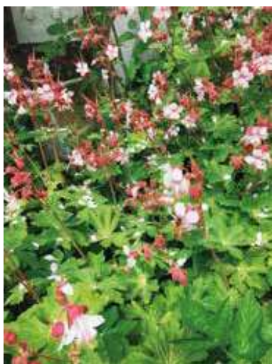
Figur 6. Storrodet storkenæb – Asta Fink (22. maj, Fredericia)