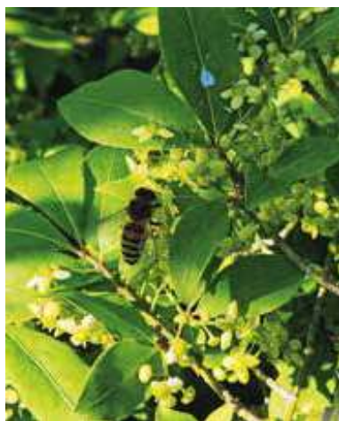
Figur 4. Benved - Bente Olsen (23. maj, Hvidovre)