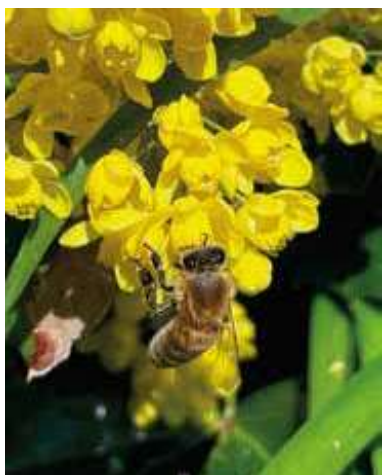
Figur 3. Mahonie – Lise Bang (30. april, Vangede)