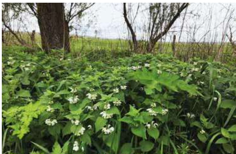
Figur 7. Døvnælde – Yoko L. Dupont (15. maj, Risskov)