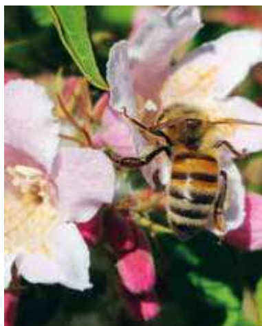
Figur 5. Dronningebusk – Bente Olsen (23. maj, Hvidovre)