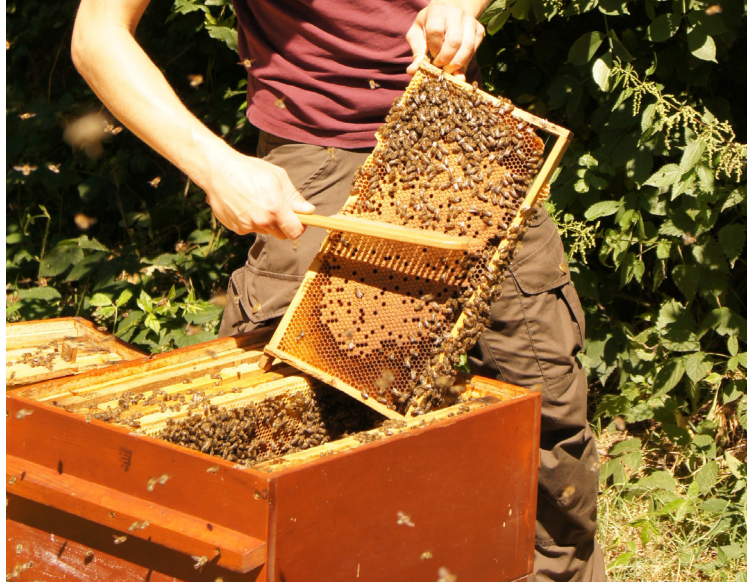
Alle bier børstes af yngeltavler ned i et tomt magasin.

Det er dog også muligt helt at undlade en terapeutisk behandling, hvis man lader en tavle med åben yngel hænge i det ellers yngelfri bistade, vil denne tiltrække næsten alle frie varroamider i bifamilien. Når miderne er kravlet ned i de åbne celler for at formere sig, og tavlen er blevet forseglet, kan man destruere denne tavle sammen med de sidste mider i bifamilien, omtrent som med fangst-tavlen (flyer 3).