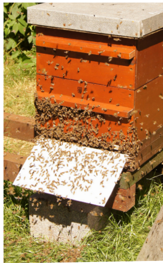
Efter bierne er børstet af tavlerne, sidder der mange bier foran stadet.

Den totale yngelfracatagelse virker først som et massivt indgreb i bifamiliens sammenhæng. Men det beror på en naturlig adskillelse af yngel og bier. Erfaringen viser, at bierne tåler denne behandling fint, og den anvendes bedst kort før, eller mens man høster honning. Tager man ynglen fra bierne 10-14 døgn før høst, falder bifamiliens behov for næring, og man kan ofte få mere honning.