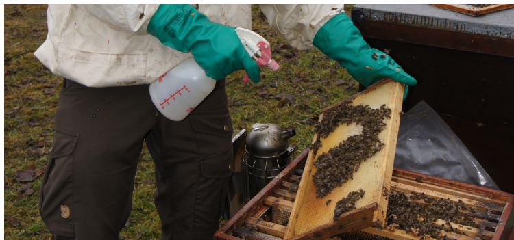
Udskiftning af mørke tavler (top) med kunsttavler (midt) og oxalsyrebehandling (bund).