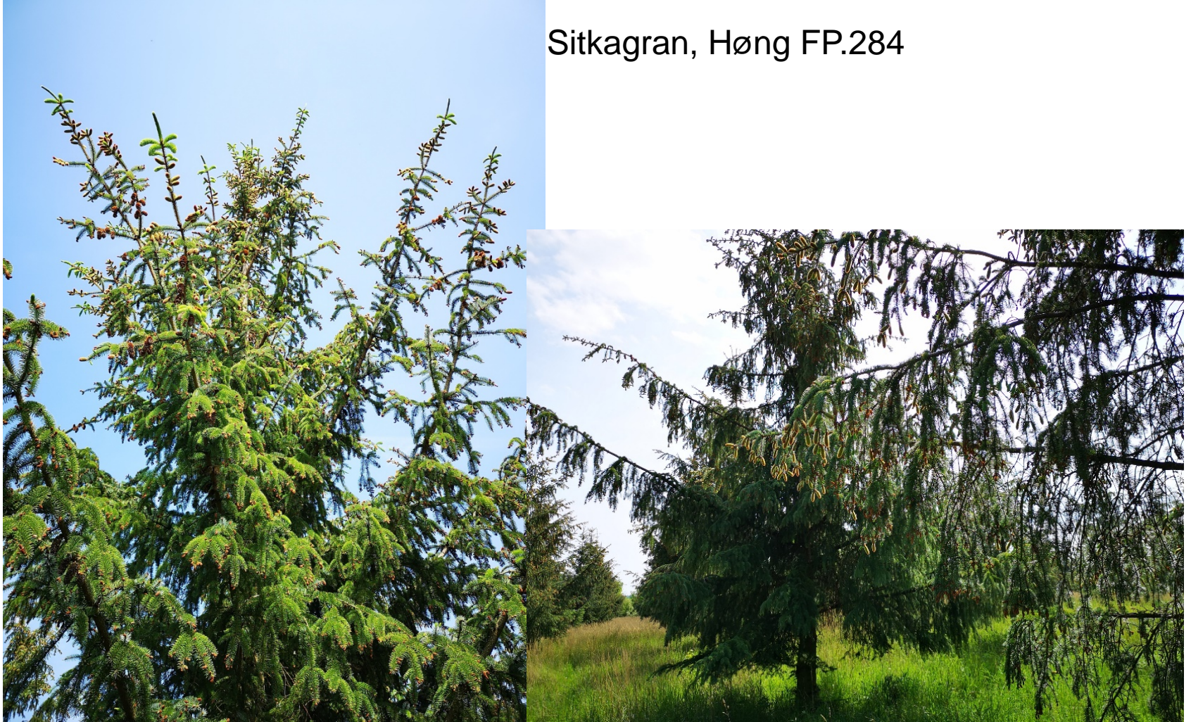
Sitkagran, Høng FP.284