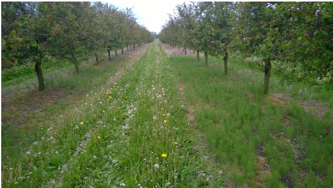
Figur 2. Eksempel på effekt af slåning overfor agerpadderok.: I denne kirsebærplantage er der under træerne sprøjtet for almindeligt ukrudt, og kun padderok står tilbage. Mellem rækkerne er der en vegetation, bestående hovedsagelig af græs og mælkebøtter, der jævnlgt slås med en rotorklipper. Kun meget få agerpadderok kan observeres mellem græs og mælkebøtter.